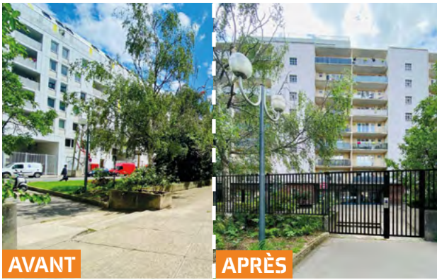
Travaux de résidentialisation 48-50 Bauer