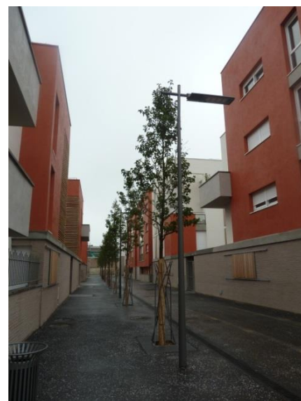
Résidence Louise Michel de la SEMISO – 84 logements sociaux