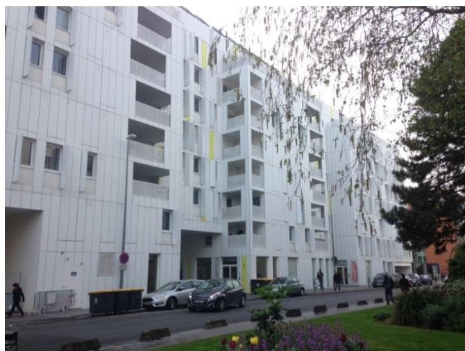
Opération immobilière composée d'une copropriété de 51 logements et d'une résidence de tourisme

Située aux 59-65, rue du Docteur Bauer, soit à moins de 400 m de l'Hôtel de Ville, l'opération d'aménagement participe à la reconversion d'un ancien site industriel.