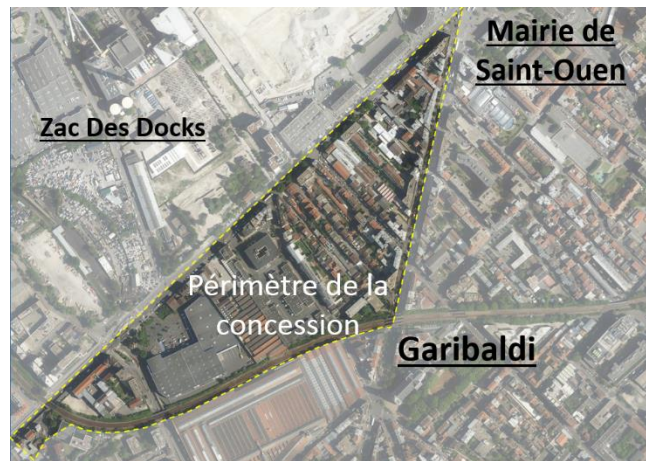
Périmètre de la concession

La concession Hugo – Péri est située au cœur de Saint-Ouen-sur-Seine, entre la ZAC des Docks et le tissu urbain ancien, entre les stations de métro « Garibaldi » et « Mairie de Saint Ouen » de la ligne 13 du métro parisien, et à proximité de deux futures stations de la ligne 14 prolongée (Saint Ouen RER C et Mairie de Saint Ouen)