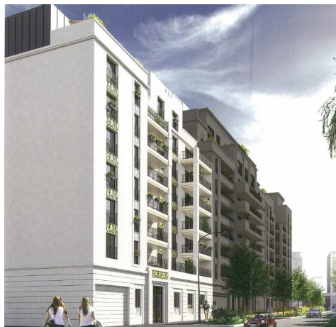
Perspective du projet – l'Îlot CARA Phase 2