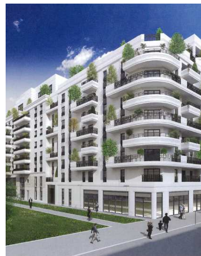
Perspective du projet – l'îlot N5